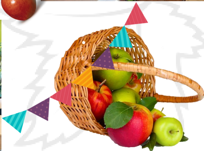
Leidėjai mažieji žurnalistai iš 3d klasės